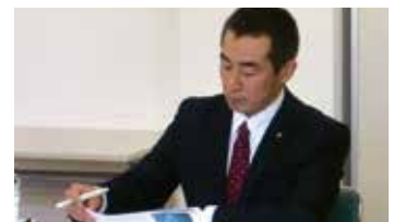
五ヶ山ダムの湖面活用視察

那珂川市では、3月議会において「ゼロカーボンシティ那珂川」を宣言しました。これは、地球温暖化対策として那珂川市が2050年までに二酸化炭素の排出量を実質ゼロにするというものです。那珂川市は面積の約7割が山林であるため、市内で排出する二酸化炭素については吸収できるのかもしれませんが、地球温暖化に市や県境、国境は関係ありません。近隣の山林が少ない自治体とも広域連携を行って取り組んでいかなければなりません。太陽光発電などによる自治体の再生可能エネルギー導入は、電気の地産地消を促進し、地域経済の活性化につながる事が期待されています。SDGsをはじめとした持続可能な社会の仕組みづくりに向けて、私たち議員もさまざまなことを提案しながら、地球温暖化対策として二酸化炭素排出量の削減に向けて取り組んで参ります。