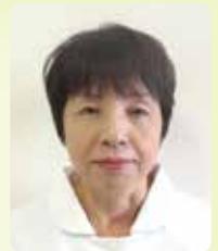
地方独立行政法人 くらて病院

処遇改善は、私達看護職の長きにわたる願いです。今後はコロナ対応医療機関だけではなく、すべての看護職の処遇改善につながることを願っています。現政権は処遇改善を公約に掲げています。大いに期待したいと思います。