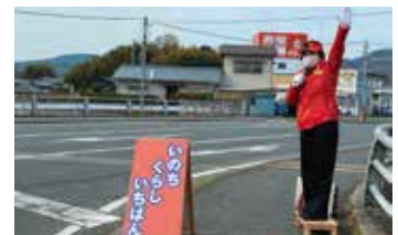
週末は必ず街頭です