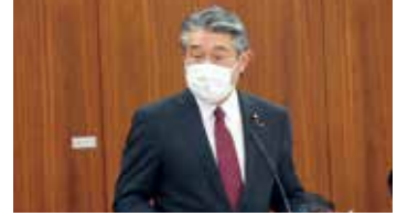
行政監視委員会にて質問