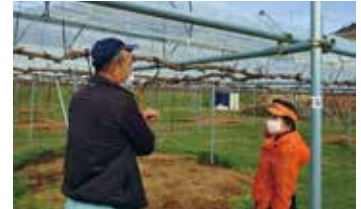
地元農家からヒアリング

待遇について、業務内容について、看護現場は多くの課題を抱えていますが、いつの時も、政策立案の基本となるのは、現場の声です。誇りをもって看護職を続けられる職場環境の整備に貴連盟の皆さまと一緒に取り組んで参りたいと存じます。