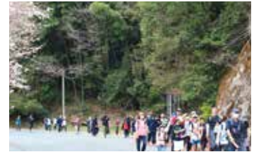
第22回21世紀青少年チャレンジウォーク

さて、今年も3月25日、第22回21世紀青少年チャレンジウォークに参加しました。新しい仲間や異年齢(小4~70歳前半)との相互交流を深め、助け合いながら早春の小道を歩き、ふるさと八女の素晴らしい自然を再確認、長距離(32km)を歩きとおす忍耐力を身につけ、心豊かでたくましい子どもの育成を図る事を目的としています。気温は、20度を超す春爛漫の絶好のウォーキング日和。立花支所を出発し、飛形山(標高444.9m)~松尾弁財天~道の駅たちばな~立花支所(ゴール)。コース上にはチャレンジ課題があり、仲間と協議しながら歩く参加者、ゴールまで誰一人の脱落者も無く完歩できました。参加者の方々の素晴らしい精神力と、忍耐力の持ち主である事に、ただ感服するばかりでした。私は日頃これといった運動はしていなかった為か、膝・足首が悲鳴をあげていましたが、周りの方々に温かい励ましの言葉を掛けていただき何とか完歩できたと思います。コロナの収束はまだですが、今後色々なことにチャレンジして行こうと思いますので、皆様の更なるご支援ご指導を切にお願い致します。