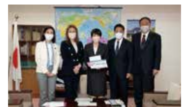
政調会長申し入れ