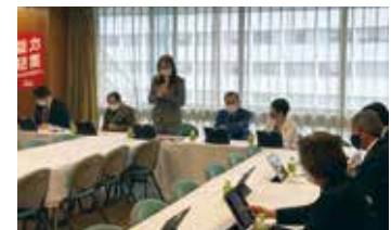
特命委員会にて議論