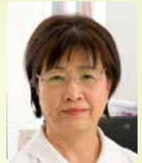
医療法人 医和基会 戸畑総合病院

2年前からの新型コロナウイルス感染症の流行により、公私ともに行動制限を止む無く行っていますが、満開の桜の花は今年も人の目を楽しませてくれました。桜の美しさに集合して酔いしれる日を待ち望んでいます。